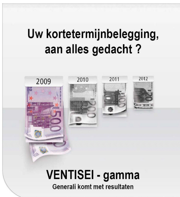
Algemeen netto-rendement sinds de creatie van het gamma