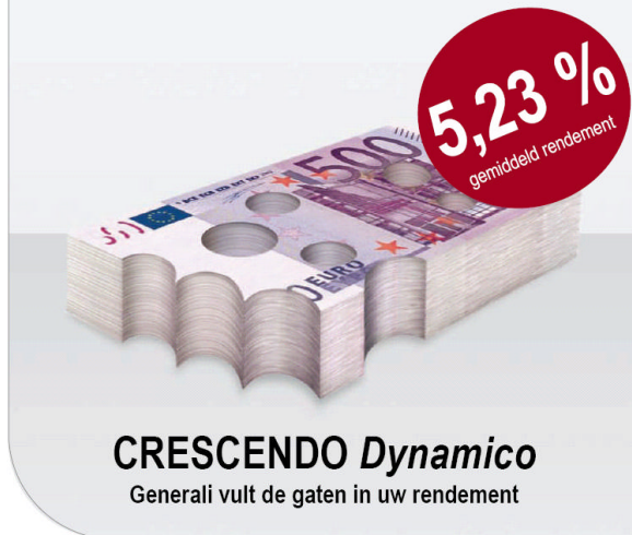
Globale netto-vergoeding van CRESCENDO Dynamico

Denkt u aan alles als u uw centen belegt ?